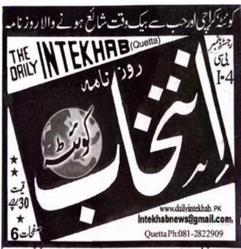
جلد نمبر 31 مردن على 21ريل 2024 مرطابق 22 روضان المبارك 1445ه المرونبر 93