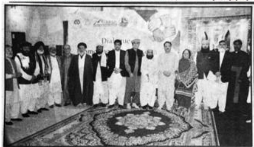
ائيكر باجتان اسمياكين وعداقات البرز في كاني آرائ في اور في فيات كاشتراك معهودت إلى عمراتريب كالعقام ركروب فوا