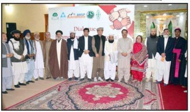
ائلیکر بلوچتان اسمیل کیٹن رعبدالخالق انجاز کی کابی آرایس لی اور لی لی اے کے اشتراک سے میتھوڈ سٹ جرچ می تقریب کے اختتام برگروپ فوٹو